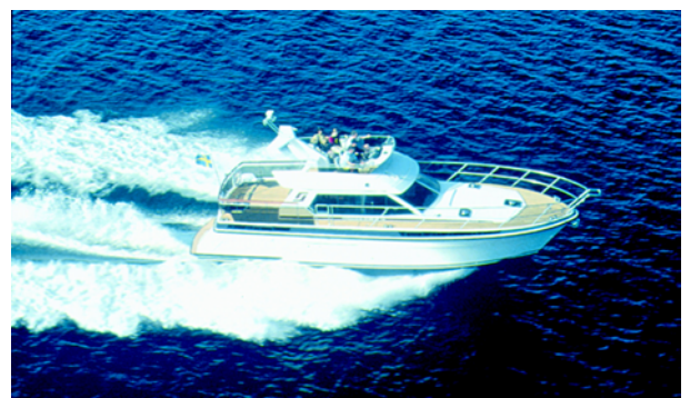
Exempel på användningsområde.